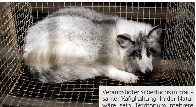
Verängstigter Silberfuchs in grausamer Käfighaltung. In der Natur wäre sein Territorium mehrere Quadratkilometer gross.

Pelztiere werden auf grausame Weise getötet. Eine Pflicht zur vorgängigen Betäubung wie bei Nutztieren gibt es meist nicht. Um das Fell nicht zu beschädigen, werden die Tiere brutal erschlagen, vergiftet, vergast, erwürgt oder per Stromschlag getötet. In China werden Pelztiere oft nur niedergeknüppelt und noch bei Bewusstsein gehäutet.